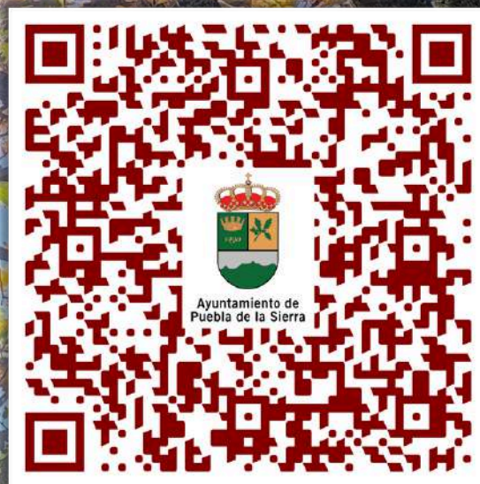
Rutas nivel alto