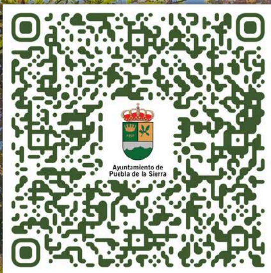
Rutas nivel bajo y medio

Leyendo este QR tu móvil abrirá la aplicación y mostrará el mapa con todas las rutas para que decidas cual te apetece hacer hoy y cual dejar para mañana. ¡Así de fácil!